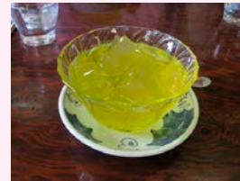
愛玉子（オーギョーチ）