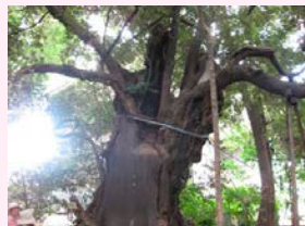
「玉林寺」樹齢600年のシイの木

善光寺坂を根津駅へ。樹齢600年のシイの木がある「玉林寺」に。根津銀座通り商店会を抜け根津駅前へ。お昼は串揚げ「はん亭」。明治時代に建てられた総けやき木造3階建です。昼膳は、串揚げが8種類も付いてお得です。根津神社の手前に「根津教会」がありました。木造の礼拝堂は1919年に建てられたそうです。今回は、谷根千の下町情緒にふれたお散歩になりました。