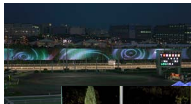
大きな美しいスクリーン

歳入の1つとして、本日視察した大井競馬場からは、2億5千万前後の歳入があります。こうした、自主財源確保も大切です。(途中 省略)