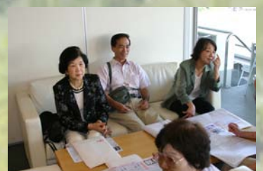
窓際の席からはレースコースが一望です。