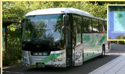
いよいよ出発！ 車中では、福引大会で盛り上がりました。