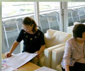
次は何を買おうかしら。