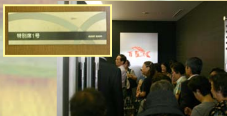
到着後、エレベーターで特別室へ

発行：えびさわけいこ ひまわり会事務局 連絡先：〒112-0003 文京区春日1-9-27-302 http://ebisango.sakura.ne.jp/