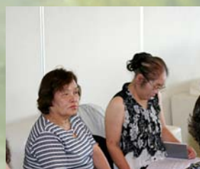
いよいよ馬券購入です。