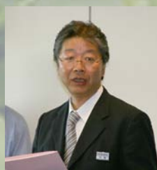
競馬場の方から親切に ご説明いただきました。