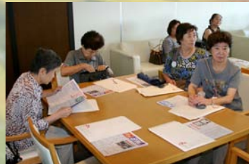
女性陣は、初めての競馬場に少々緊張 気味でしょうか・・・