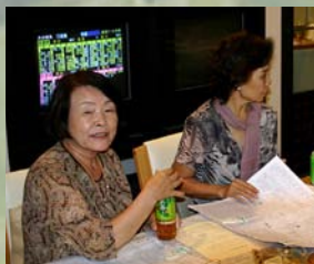
オッズも気になります。