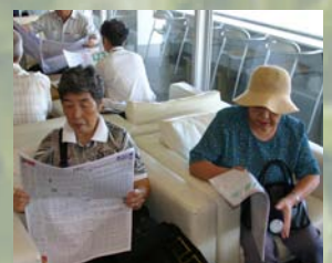
だんだん真剣になってきました。