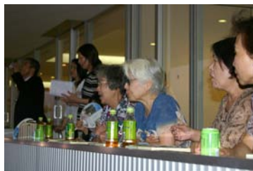
バルコニーで涼しい風にあたりながらレース観戦中。