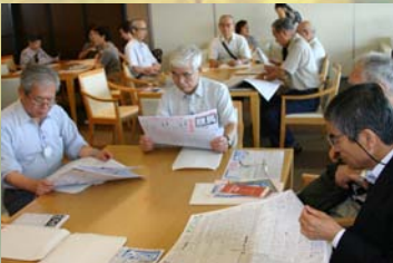
男性陣は、早くも新聞に見入っています。