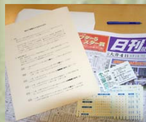
競馬の初心者用の説明書。 購入票・馬券・新聞です。