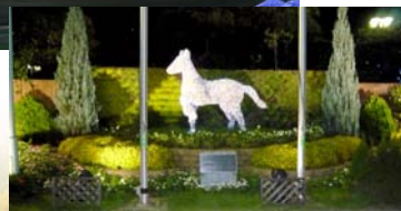
夜はライトアップやイルミネーションがとてもきれいです。ぜひ、一度訪れてみて下さい。