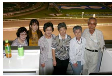
バルコニーでみなさまとパチリ。