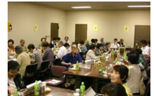
自分が写っている、スライド見つかりましたか?