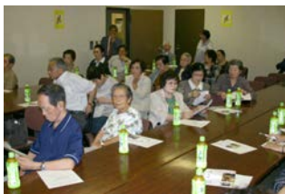
足元が悪い中たくさんの方にご参加いただきました。