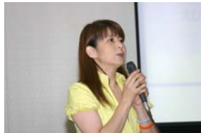
えびさわから区政報告がありました。(内容は裏面)