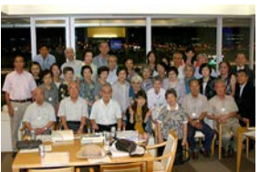
昨年9月の大井競馬場視察。初めての勉強会でした。