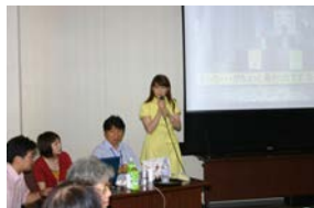
1年間の歩みをスライドにして食事をしながら鑑賞しました。