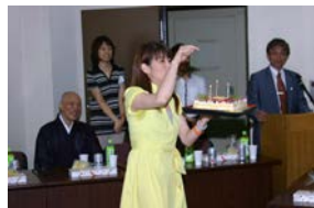
ひまわり会1才の誕生日。歌とケーキでお祝いです。