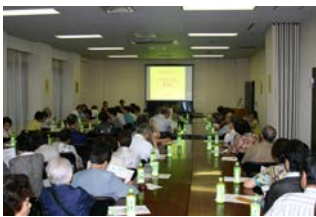
皆さん熱心に聞いています。