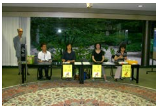
昨年の7月4日にここ護国寺にて発足会を開いてから、あつという間の1年でした。勉強会や懇親会など皆さんと楽しく出来ました。