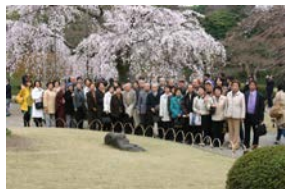
今年3月、後樂園のお花見。しだれ桜が満開でした。