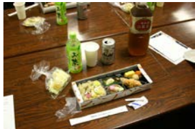
お弁当は、いかがでしたか。おせんべいの差入れもありました。