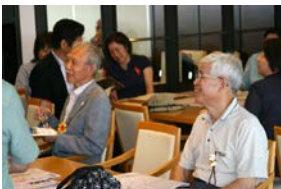
こちらの方々は余裕ありそうですね。