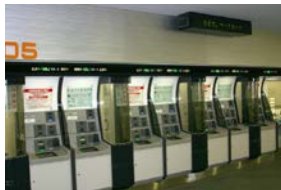
特別室の前には馬券の自動購入払戻機があります。