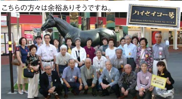
ハイセイコー号の像の前で記念撮影。ハイセイコーはTCKで6連勝後中央に移籍し、国民的アイドルになりました。

紅葉の候、皆様におかれましてはご健勝のこととお慶び申し上げます。昨年引き続き九月二十八日に「財務の勉強会&大井競馬場視察」を開催しました。この号では、その模様を報告させて頂きます。ご参加くださった皆様ありがとうございました。