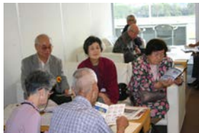
お勉強の後は、馬券の購入方法の説明がありました。