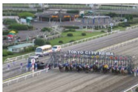
レースは15:00~始まっています。ゲートが開いて一斉にスタート!