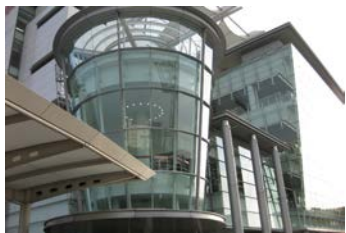
こちらの建物の4階が特別室になります。