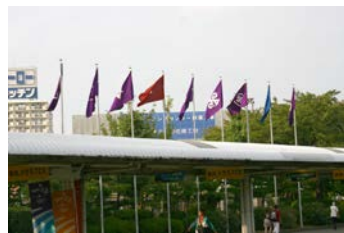
入場ゲートが見えてきました。あっという間に到着です。