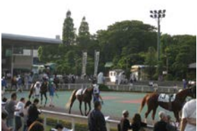
こちらはパドックです。出走前の馬を観察することができます。