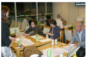
施設見学が終了し、特別室でレースを楽しみました。