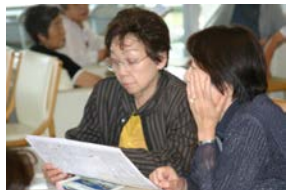
皆さん新聞や資料を熱心に見ています。