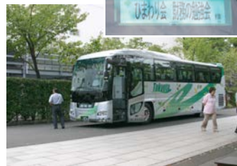
貸し切りバスで、大井競馬場へ向かいます。