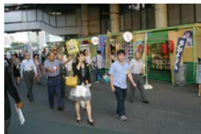
今回は施設内の見学もしました。