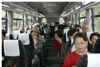
皆さん乗車して、いよいよ出発です。