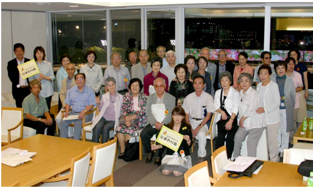
昨年に引き続き、2回目の大井競馬場視察です。今回もたくさんの方にご参加いただきました。