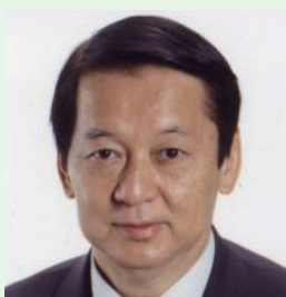
宮崎文雄 自由民主党文京区議団副幹事長